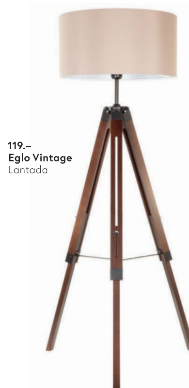
119.- Eglo Vintage Lantada